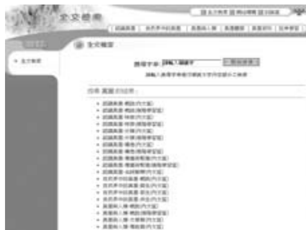
圖6. 「真菌一族」主題版全文檢索