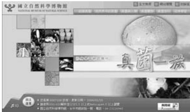
圖4. 「真菌一族」主題版首頁