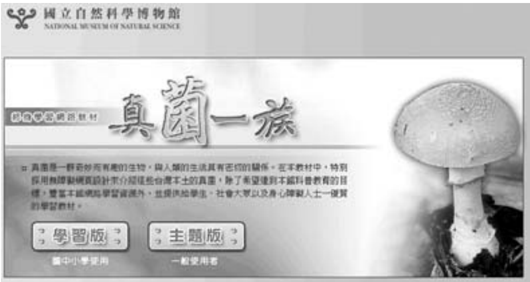
圖2.「真菌一族」網路教材首頁